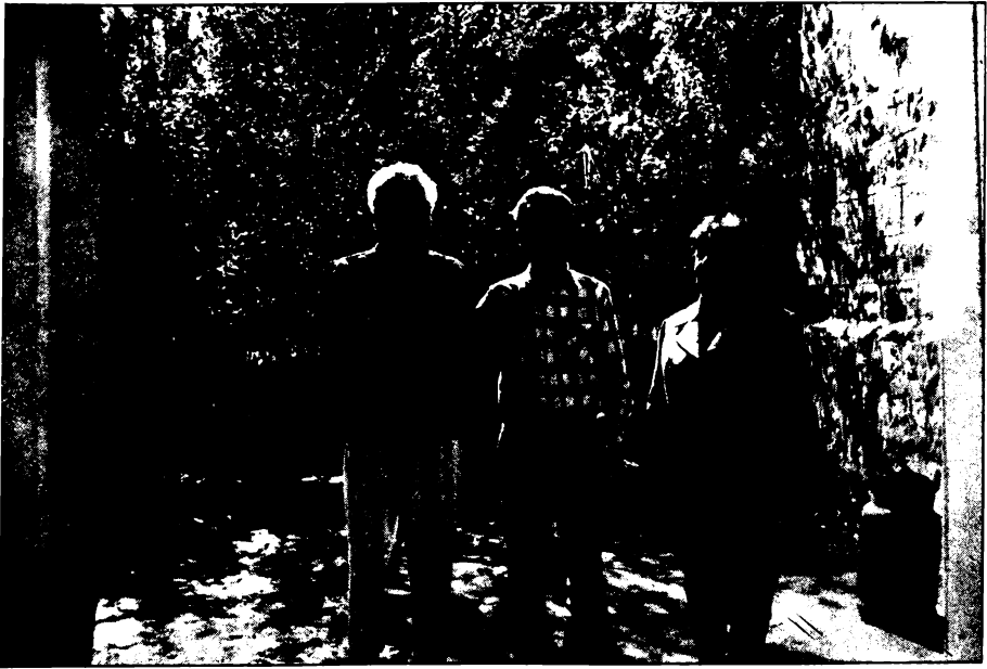
فى شقلاوة استعداً للمؤتمر الخامس للحزب الشيوعى العراقى فى ١٠/١٠/١٩٩٣